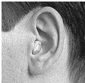
Een in-het-oor hoortoestel

zijn en meer op de “normale” plaats zitten. Toch is een toestel in-het-oor soms niet mogelijk vanwege de aard van het gehoorverlies, een te smalle gehoorgang of oorontstekingen.