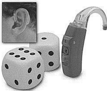
Een zeer klein achter-het-oor hoortoestel (met enkele forse dobbelstenen)

De toestellen achter het oor als kleine banaantjes die met een doorzichtige slang vastzitten aan een plastic tuitje dat in de gehoorgang wordt gedragen (het oorstukje). Overigens: ook het kleinste toestel heeft een batterij nodig. Die moet u meestal zelf betalen.